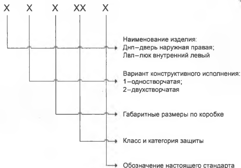
Примеры условного обозначения

4.3.2 Устанавливают следующую структуру условных обозначений ВЗК в документации при оформлении заказа.